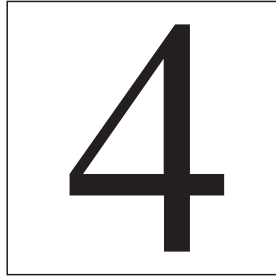
Abb. 1. Beispiel für ein kleines Bild, bei dem die Bildunterschrift neben der Abbildung platziert wird.

Kleinere Objekte können beliebig platziert werden (Abb. 1). Verwenden Sie dafür die Umgebungen \SCfigure und \SCtable aus dem sidecap -Paket. Der Text wird hierbei neben den Objekten oben bündig ausgerichtet.